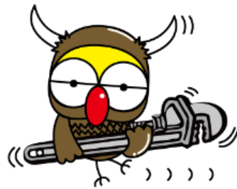
東京車輛キャラクター 「ヴィークル」LINE スタンプ バッファローくん